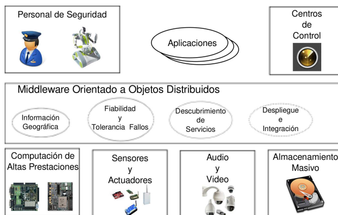
Ilustración 1: Visión Global de la Plataforma HESPERIA

Atendiendo a los requerimientos mencionados, la plataforma HESPERIA ha sido diseñada conforme a los elementos básicos mostrados en la Figura 1. De estos componentes, el elemento central es el middleware orientado a objetos distribuidos (MDOO), que es el encargado de proporcionar transparencia de localización a los servicios distribuidos en el entorno de forma eficiente (utilización de protocolos binarios), flexible (soporte a una enorme variedad de lenguajes de programación y sistemas operativos) y con soporte a servicios comunes (gestión de canales de eventos, gestión de actualizaciones, etc.).